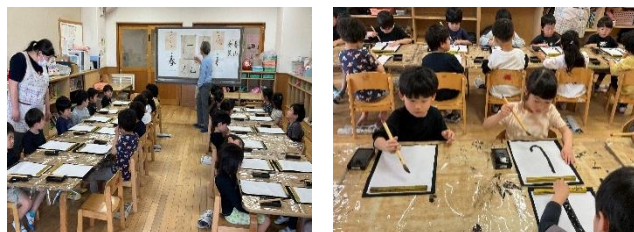
道組 初めての書道の様子 真剣な表情、正しい姿勢で取り組んでいます